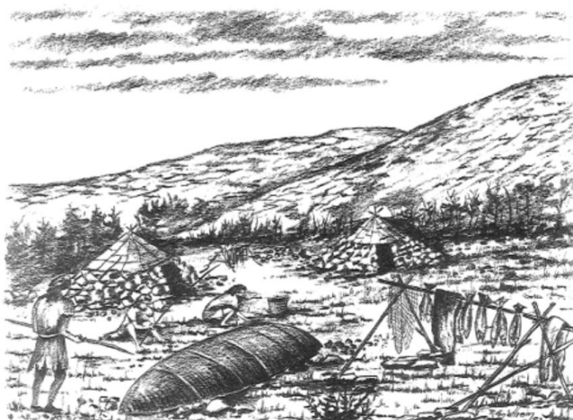
Tegninger av: Ragnvald Grjotheim